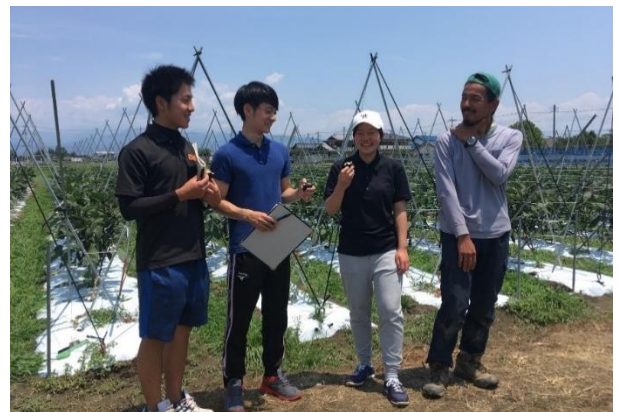
【産地見学：サラダボウル（山梨県中央市）】