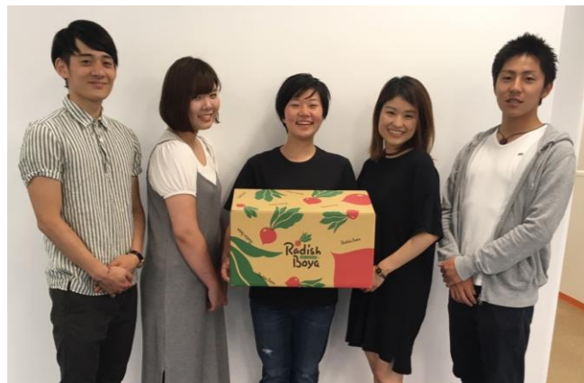
【日大商学部秋川ゼミ生 3年生】