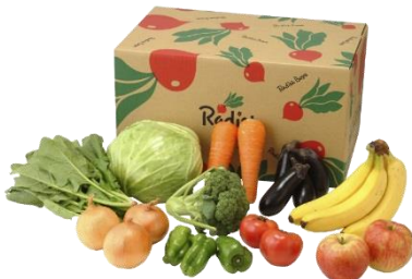
【ぱれっとイメージ】

近年の日本の食生活は、ライフスタイルの多様化（女性の社会進出の促進などから共働き家庭が増加傾向にある）から、調理に割く時間が減少しつつあります。その影響もあり、らでいっしゅぼーやは1988年の創業当初より旬野菜のセットボックス『ぱれっと』を販売していますが、商品の購買動向をみると、野菜の単品購入の伸張に対して『ぱれっと』は微減傾向にあり、当社でも課題となっています。