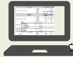
ウェブで栄養価公開