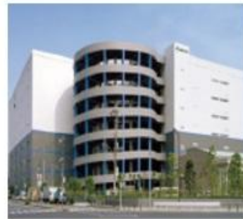
法人専用物流センター