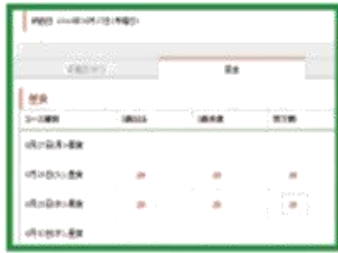
ステップ(1) 納品日選択・必要人数入力