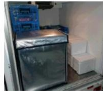
専用配送トラック